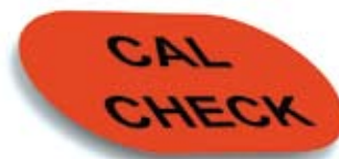
Patrones de calibración

Sistema patentado CAL Check de calibración por el usuario con patrones certificados.